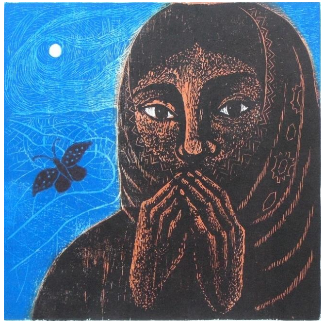
Poli Marichal, Premonición, 2012