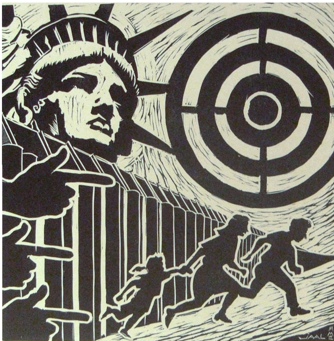
José Antonio Aguirre - MXXII, 2012 Linocut copy